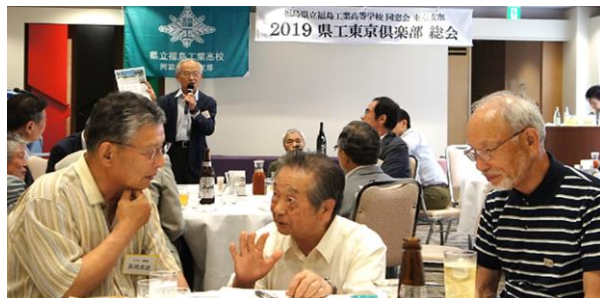
昨年度総会後の親睦会、和やかに歓談する会場