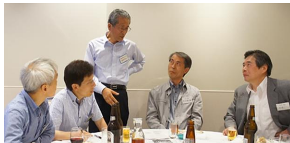
昨年度総会後の親睦会、和やかに歓談する会場