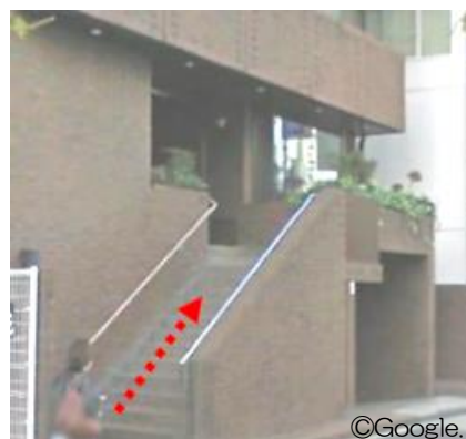
東京ガス四谷クラブ 階段を上がる