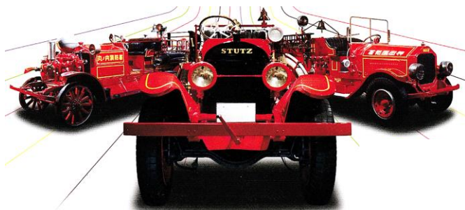
「消防博物館」案内チラシより

【年会費お願い】 総会当日、平成 30 年度の年会費（1,000 円）を受領したく、ご協力をお願いします。